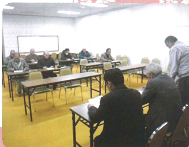
前回の地域総代会の様子（平成29年2月）